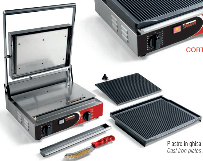
Piastre in ghisa smontabili Cast iron plates removable