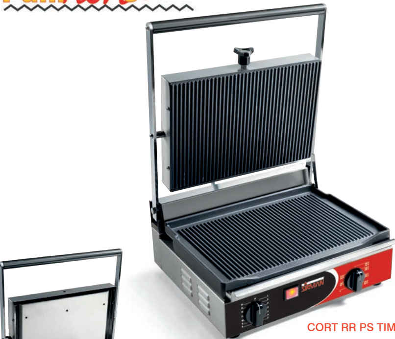
CORT RR PS TIMER