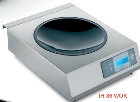
IH 35 WOK