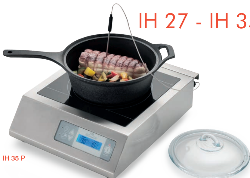
IH 35 P