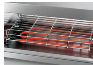
Resistenze corazzate Shock-proof, coated heating elements