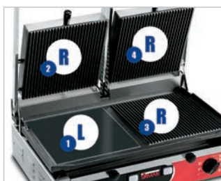
Legenda modelli Models key