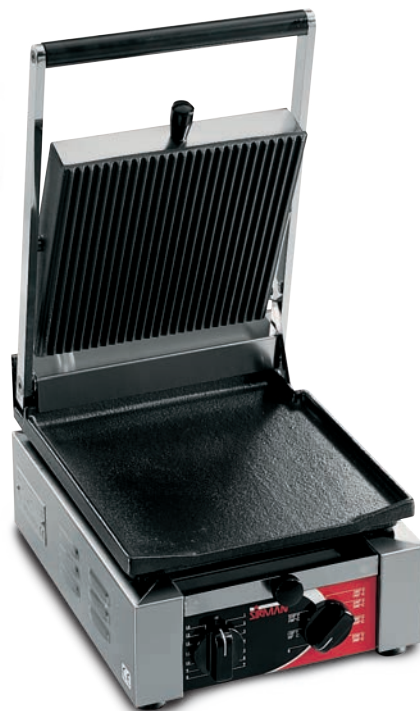
ELIO LR TIMER